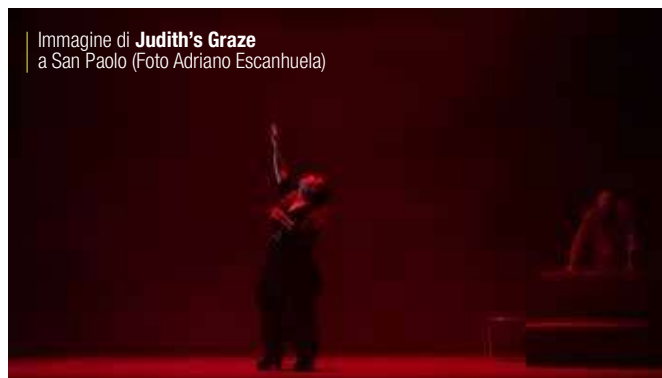
Immagine di Judith's Gaze a San Paolo