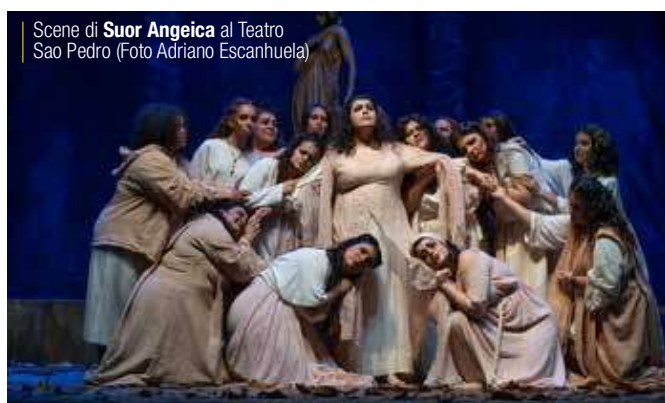
Scene di Suor Angeica al Teatro Sao Pedro